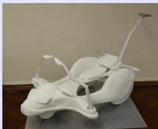
Чистовые (демонстрационные) макеты